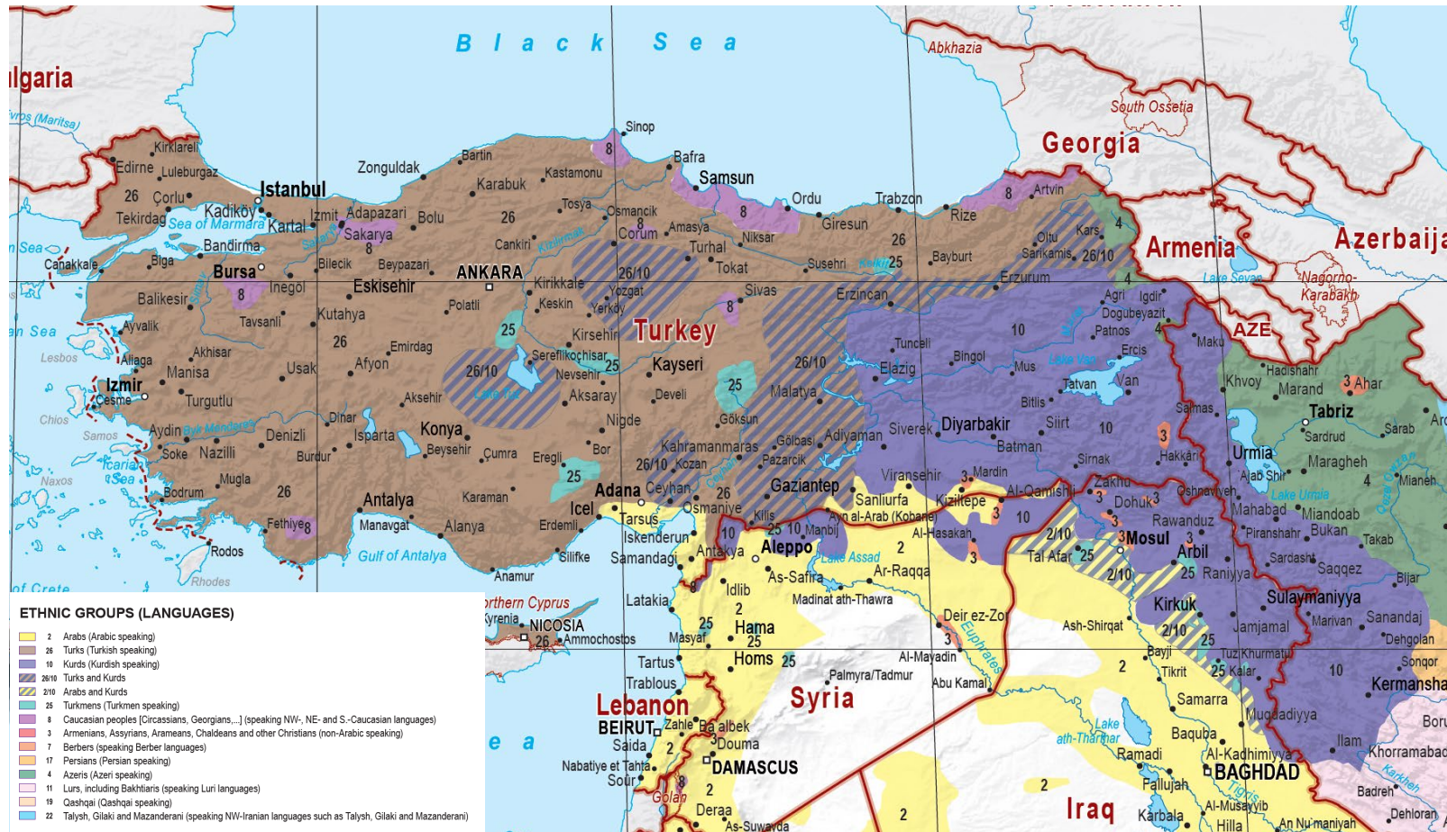
Kort over etniske grupper i Tyrkiet og omegn.